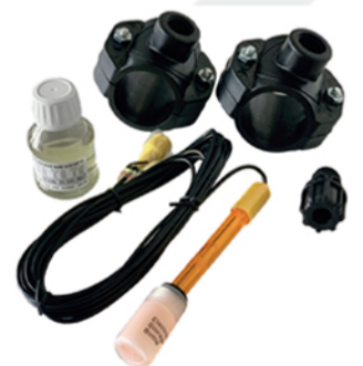
Rx-Installationsset (468mV) (Art.-Nr. 759.9992)