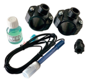
pH-Installationsset (klein) (Art.Nr. 759.9998)